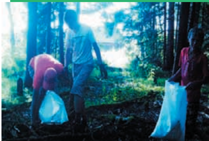
Реализация проекта «ШКОЛЬНЫЙ ПАРК»