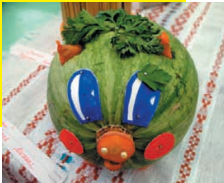
▲ «Поросенок Хрю-Хрю»