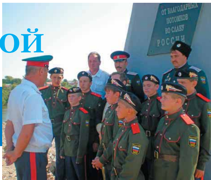
▲ У памятника «Ермака» Награждение казаков ▼

енную дисциплину, число ребяташек, желающих приобщиться к казачьим рядам, увеличивается. Ребята живут весело, интересно, поют казачьи песни и танцуют на всех праздниках. Атаман Рубцовского Станичного Общества наградил за усердие ребят нагрудными знаками, двум кадетам присвоено звание «приказный».